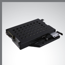
多媒体扩展舱 第二存储装置