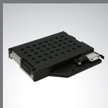
多媒体扩展舱 第二颗附加电池组