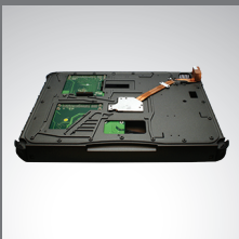
PCI/PCI-Express 3.0 扩展单元