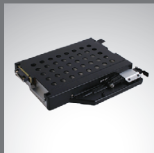
多媒体扩展舱 第二存储装置