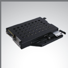
多媒体扩展仓 第 2 个存储装置